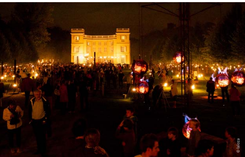
Het huwelijksfeest van Wolfgang-Guillaume d'Ursel en Flore d'Arenberg tijdens de Kasteelfeesten in 2012