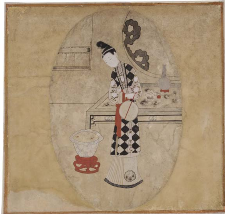
Met de hand afgewerkte Chinese prent, gebruikt als deurstuk in kasteel d'Ursel

Ook na de ontwikkeling van 'echt' Chinees behang bleef men nog geruime tijd ook Chinese prenten en schilderijen als interieurdecoratie gebruiken, soms als