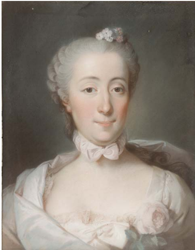
Toegeschreven aan Pierre Bernard. De hertogin d'Ursel, geboren Éléonore de Lobkowitz , pastel, 52,5 x 40 cm, ca. 1756 (privéverzameling)