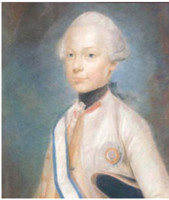
Joseph Ducreux. Aartshertog Maximiliaan Frans van Oostenrijk (1756–1801) , pastel, 68 x 52 cm, 1769 (Château de Versailles).