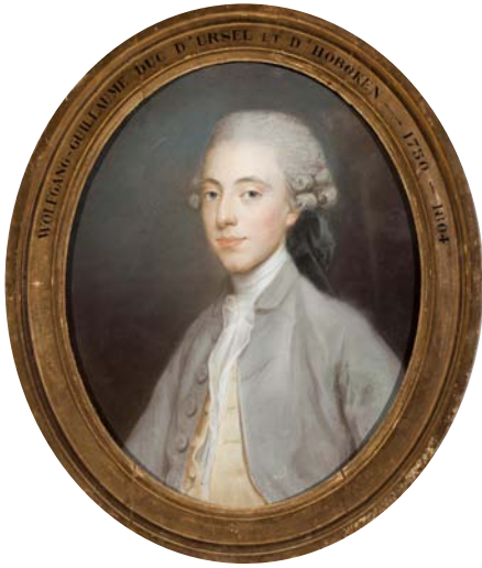
Joseph Ducreux. Wolfgang-Guillaume, derde hertog d'Ursel , pastel, 75 x 63 cm, 1767 (collectie van de hertog d'Ursel, langdurige bruikleen aan Kasteel d'Ursel).