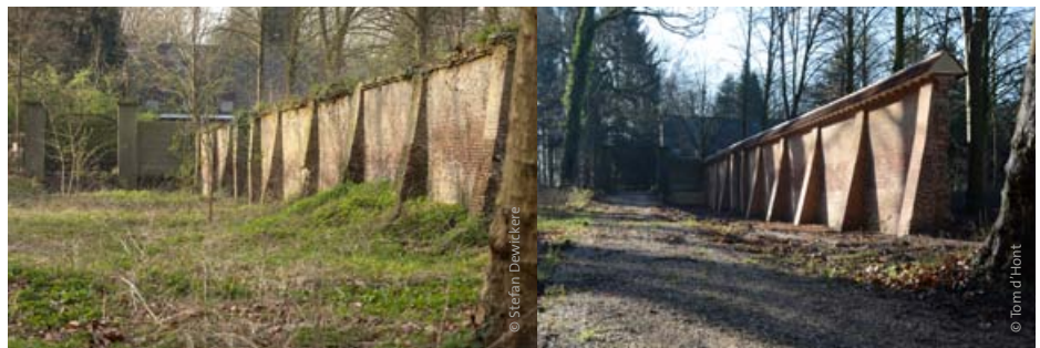
De tuinmuur voor en na restauratie