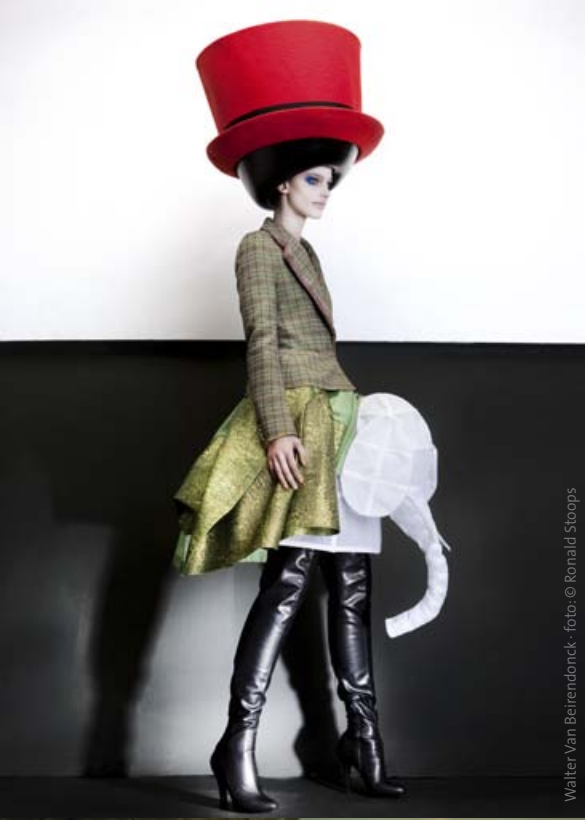
Walter Van Beirendonck