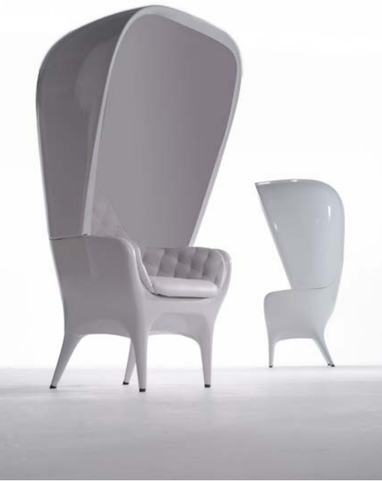
Jaime Hayon, Showtime Poltrona voor BD Barcelona (2007)