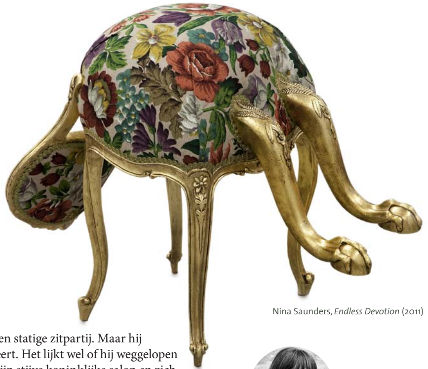
Nina Saunders, Endless Devotion (2011)

‘Nina Saunders maakt werken als een ‘lekkende piano’ of een ‘smeltende bank’. Tweedehands fauteuils krijgen een tweede leven door de toevoeging van extra poten of gigantische tumorachtige structuren. Met veel humor haalt ze objecten zo uit hun gekende comfortzone, en vergroot net hierdoor alle connotaties met het gekende alledaagse. Ik vind het geweldig als er beweging en leven zit in een meubel. Met zijn vergulde poten en weelderige stof hoort Endless Devotion eigenlijk thuis in een streng 18e-eeuws interieur. Hij hoort symmetrisch te zijn, klaar om te dienen