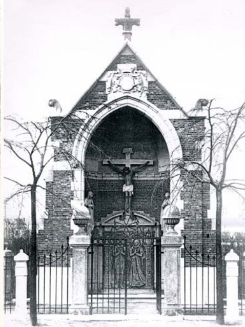
De Hobokense calvariekapel kort na de bouw in 1923. De twee zuilen met de urnen werden hergebruikt en zijn donkerder dan de kleinere, nieuwe zuilen.