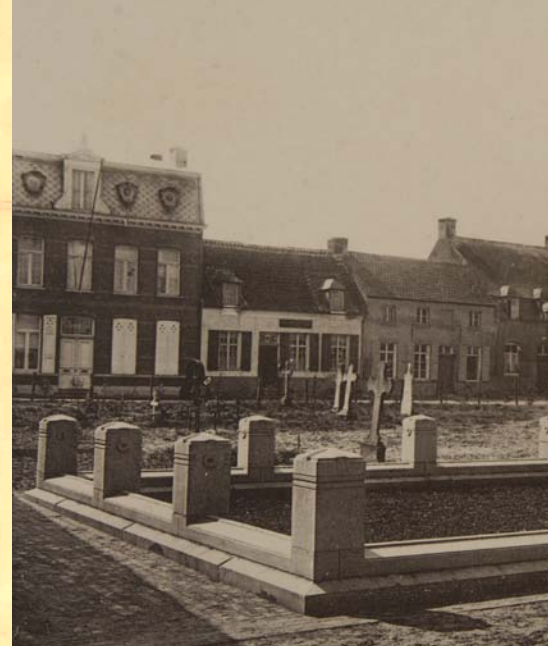
Het grafmonument in Hingene kort voor de oplevering in 1906.

In het voorjaar van 1906 zijn de werken klaar en op 7 augustus komt de pas benoemde aartsbisschop Désiré Mercier naar Hingene om de grafkapel en de kerk (die als zes jaar klaar was) in te wijden. De kist van hertog Joseph vindt eindelijk een laatste rustplaats.