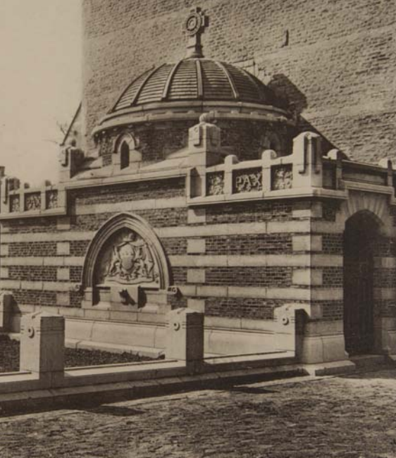
De smeedijzeren kettingen tussen de pilaren en het liggende kruis moeten nog worden geplaatst.