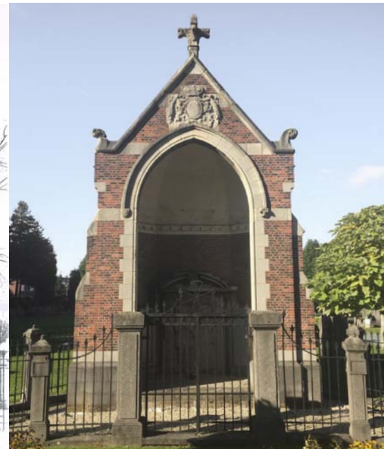
De calvariekapel anno 2015: goed onderhouden, maar helaas zonder beelden en zonder urnen.