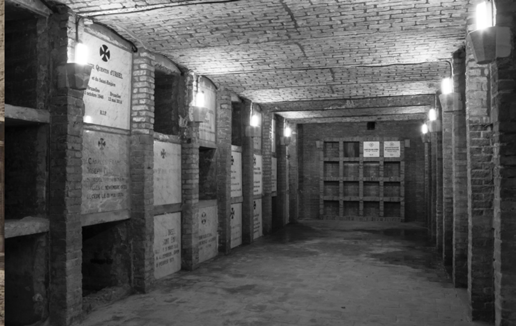
De crypte van de Hingense grafkelder.

de kapel. De familievereniging betaalde het grootste deel van de werken, maar we kregen ook subsidies van de overheid. Bij de restauratie van de oude kerk kreeg de koepel van de kapel een nieuwe dakbedekking met leien.