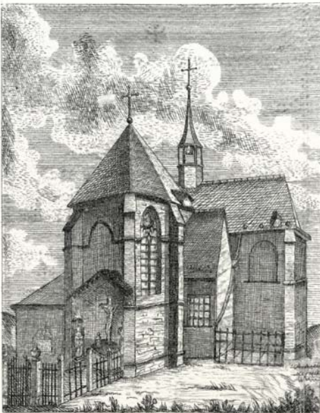
De grafkapel tegen de buitenkant van het koor van de Onze-Lieve-Vrouwekerk in Hoboken (1784). De calvariebeelden en zuilen met de urnen zijn goed te zien, de zerksteen iets minder.

Een smalle wenteltrap in de grafkapel geeft toegang tot de crypte. Onder bakstenen gewelven zijn langs weerskanten diepe nissen voorzien om de kisten in te plaatsen: aan de linkerkant voor de hertogelijke tak en aan de rechterkant voor de jongere takken die niet over een eigen monument beschikken. Na het plaatsen van een kist wordt elke nis afgesloten met een marmeren plaat.