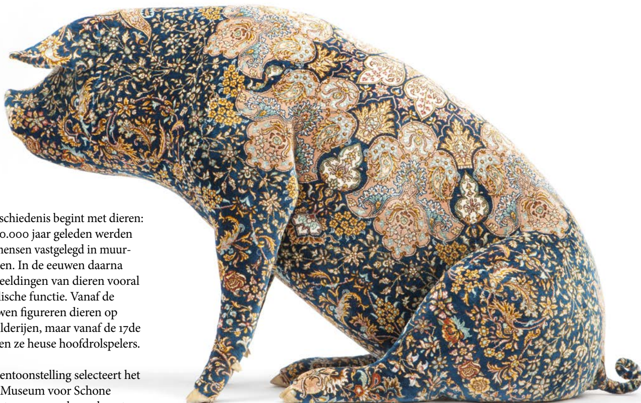
© Wim Delvoye · Qamsar , 2016 · 97 x 46 x 58 cm · Persian carpet on polyester mould

De kunstgeschiedenis begint met dieren: meer dan 30.000 jaar geleden werden ze al door mensen vastgelegd in muurschilderingen. In de eeuwen daarna hebben afbeeldingen van dieren vooral een symbolische functie. Vanaf de middeleeuwen figureren dieren op allerlei schilderijen, maar vanaf de 17de eeuw worden ze heuse hoofdrolspelers.