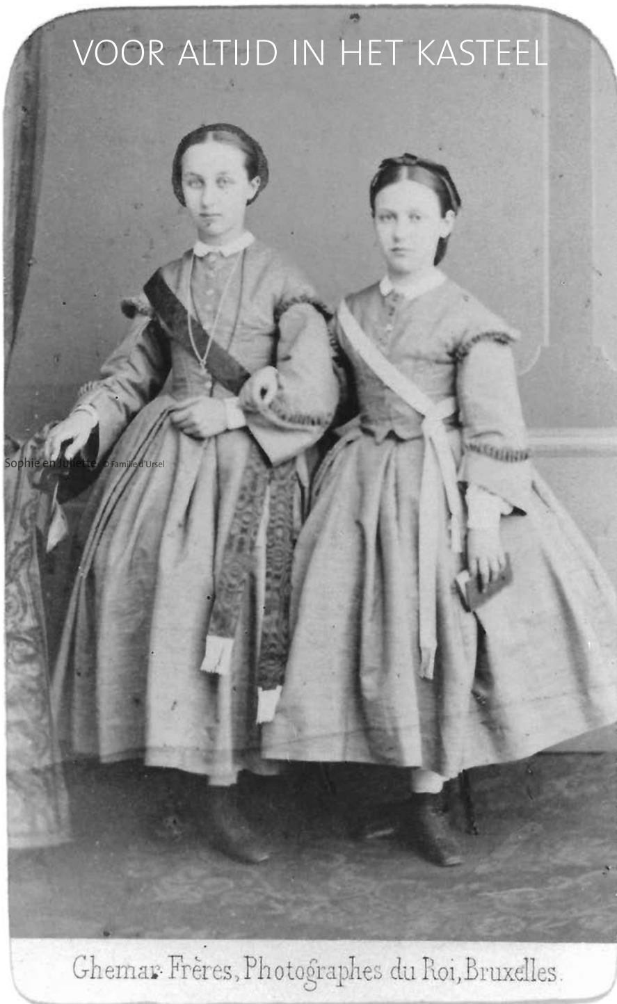
Sophie en Juliette