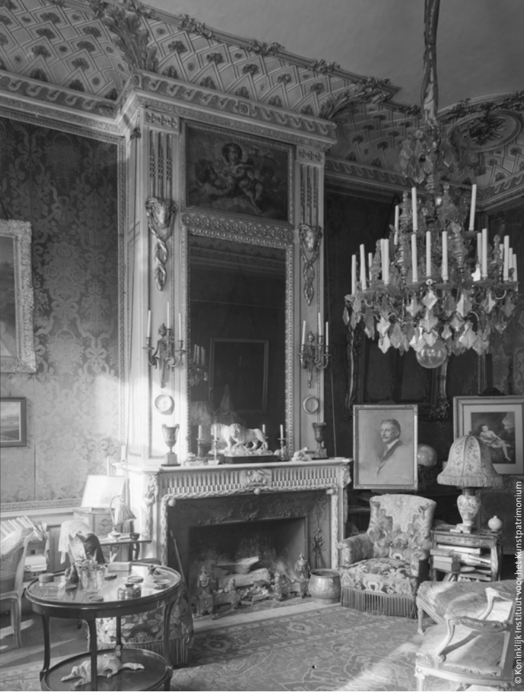
De kleine salon naar ontwerp van Laurent-Benoit Dewez

Tussen 1769 en 1773 bezorgt hertog Charles de grote ontvangstruimten hun definitieve uitzicht. We bestuderen de originele ontwerpen (en de gedetailleerde rekening) van architect Laurent-Benoit Dewez en vergelijken ze met foto's die meer dan 150 jaar later zijn gemaakt. Tijdens de Tweede Wereldoorlog worden de ontvangstruimten en de mooiste kamers in de appartementen uitgebreid gefotografeerd, voor het geval ze door bombardementen beschadigd zouden worden. Dankzij enkele 'penseelprinsessen' bestaan er ook aquarellen, schetsen en olieverfschilderijen, waarop we de salons en de appartementen in kleur terugvinden. Op basis van al deze informatie tonen we dat het h ôtel er één volgens het boekje was, waarvan zowel de decoratie als de planopbouw helemaal voldoen aan de Franse modelboeken.