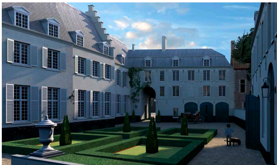
3D-reconstructie van de binnenkoer

Op de tweede verdieping van het kasteel is de glorie tijd voorbij. Je voelt hoe het hôtel begin 20ste eeuw wordt bedreigd door de aanleg van de Noord-Zuidverbinding voor treinen en de drastische modernisering van de oude wijk rond de residentie. Je ziet de plannen waarop de hertog bijna eigenhandig de lijnen uitzet om zijn huis te sparen, maar hij kan niet