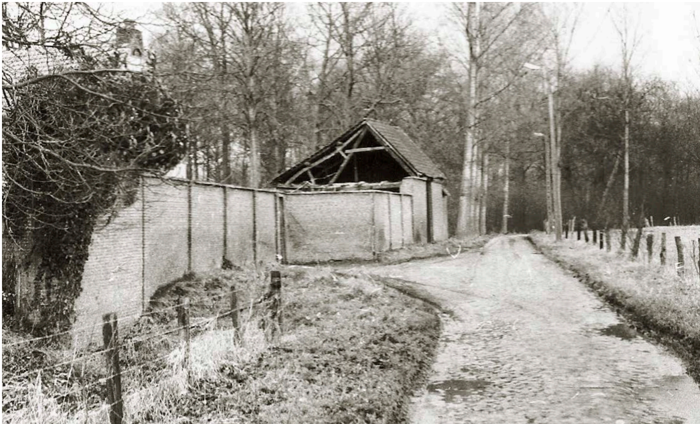
De Kleine Hinckstraat met de schuur, de muur rond het erf en links – verscholen achter klimop – het boswachtershuis

gelegen in Den Hinck te Hingene, groot 45 a 65 ca, palende ten oosten de straat, ten zuiden en westen de hertog van Ursel en ten noorden de heer Reyntiens.’