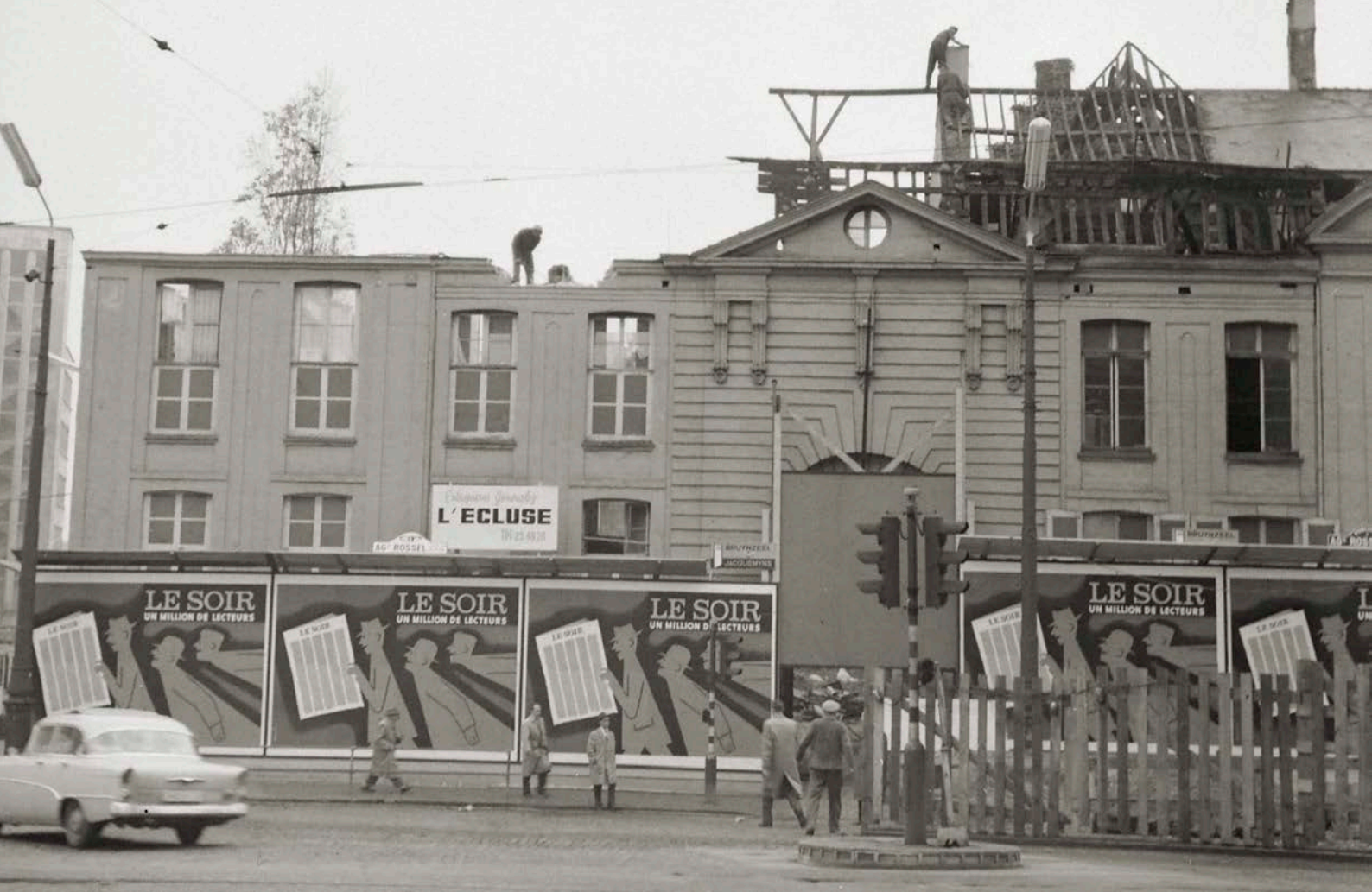
In 1960 documenteert Marcel Lebouille de afbraak

beletten dat een deel van de residentie in 1910 gesloopt wordt. Terwijl de werken in de wijk eindeloos aanslepen, herneemt het leven in het hôtel, met een grote diefstal tijdens de Eerste Wereldoorlog, een kleine brand in 1923, nieuwe functies – kantoren – en nieuwe generaties die worden geboren. Errond verschijnen nieuwe boulevards met monumentale gebouwen en het huis wordt een eiland in het midden van de hoge torens.