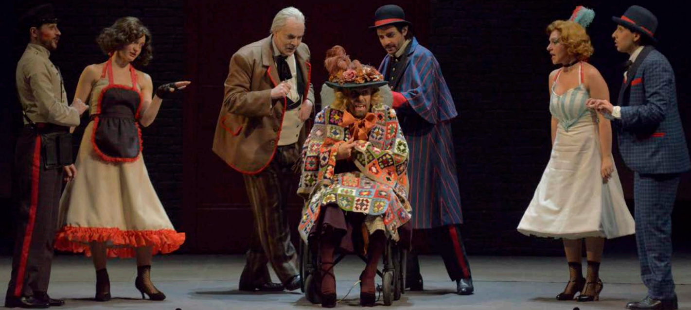
De finale met alle protagonisten

Eind januari ging een opera van 'onze' Spontini (opnieuw) in première in Venetië. Een verslag vanop de eerste rij.