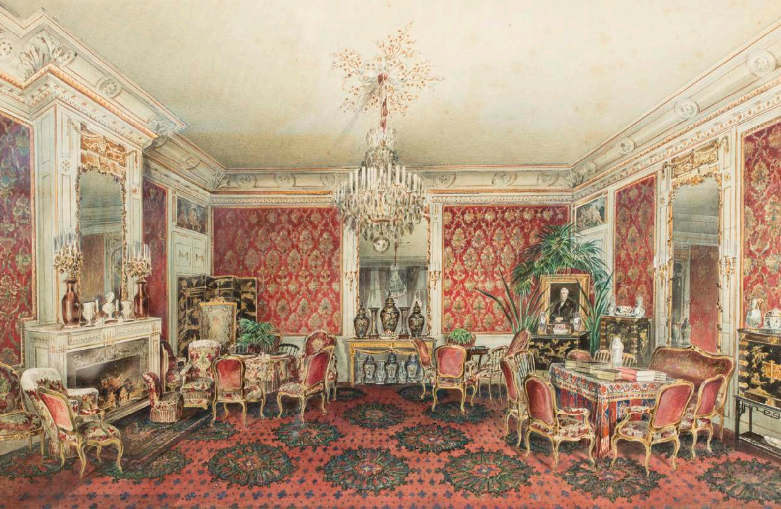
Aquarel van het grote salon door Friedrich Zeller in 1879 · Privécollectie