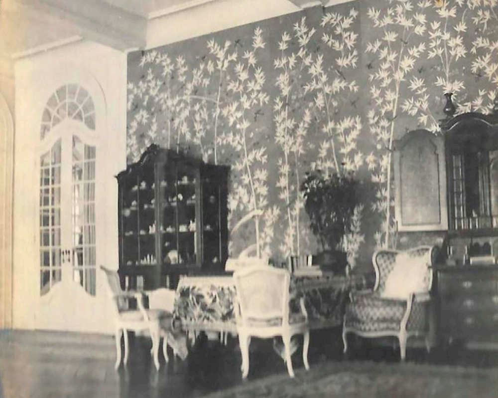
Het roze Chinese behang en de spiegeldeuren geven de grote salon een heel ander uitzicht (1911)

tachtig frank. De oorzaak van de brand bleek een onzorgvuldige herstelling aan de open haard in de kelder. Fonske vond dat de schoorsteen niet goed meer trok en had zelf een metselaar laten komen. Die had een stuk van de aangrenzende oven afgebroken en verkeerd weer opgebouwd. Toen de conciërge nadien het vuur aanstak, was hij nog opgetogen geweest over hoe goed de schoorsteen trok... In elk geval was het duidelijk de fout van Fonske, zo vond de hertog, want hij had de schoorsteen laten aanpassen zonder te controleren of het werk wel goed gedaan was. Anderzijds waren het ook zijn koelbloedigheid en daadkracht die het kasteel van de ondergang hadden gered. Als hij één seconde had gearzeld, één enkele minuut had verloren door buiten om hulp te gaan roepen, dan was zonder twijfel het hele kasteel afgebrand.