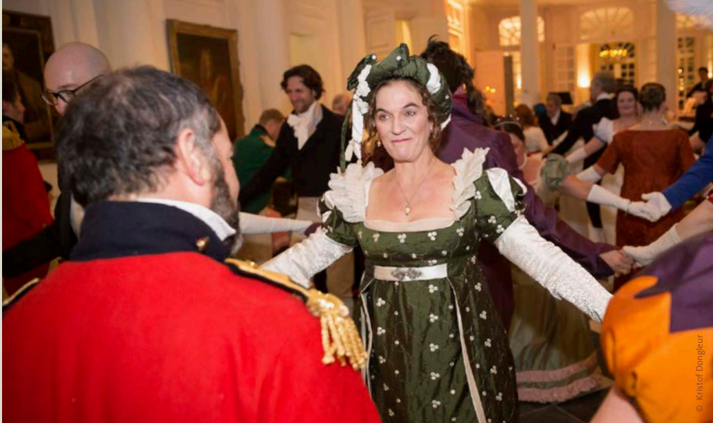
Na de geslaagde Winterbals kan je opnieuw leren dansen als een edelman!

De musici van dit Madrileense kwartet worden alom geprezen om hun rijke kleurenspeel,