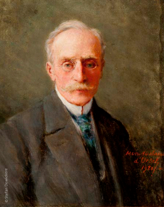
Portret van een onbekende man met knijpbrilletje door Antonine de Mun, zesde hertogin d'Ursel (1920)