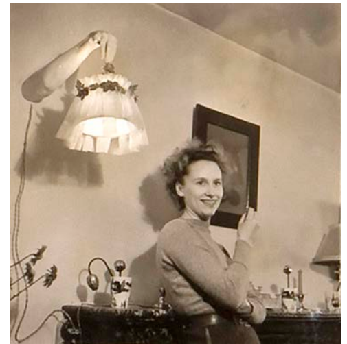
Mijn moeder bij het afgietsel van haar arm

‘Mijn oudste herinneringen gaan zeker terug tot het hôtel d’Ursel (dat indertijd werd uitgesproken als d’Urs). Het was toen al in slechte staat en het onderhoud had onze familie bijna geruïneerd. Wij woonden op de tweede verdieping die mijn ouders hadden omgevormd tot een weinig gerieflijk appartement. Doordat de