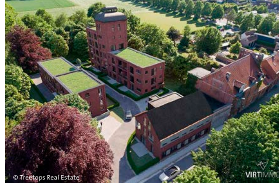
Visualisatie van het herbestemmingsproject

‘We bekeken eerst en vooral welke delen van het complex we konden behouden’, zegt Yannick Meys. ‘De gevel is niet beschermd, maar we gaan hem wel bewaren omdat hij een grote symbolische waarde heeft voor het dorp. Ook de brouwerijtoren hadden we graag laten staan, maar hij is in te slechte staat. De achterkant van het gebouw staat immers al meer dan vijftig jaar leeg en is volledig overwoekerd door groen. De klimplanten houden het geheel nog net recht. We gaan de bouwvallige brouwerijtoren afbreken, de bakstenen op de site zelf reinigen en de toren opnieuw opbouwen zoals hij was. De oude bottelarij, die als laatste werd aangebouwd en nog in goede staat is, zal worden gerenoveerd. Alles samen plannen we op de site 22 appartementen. In de binnentuin willen we graag een grote brouwketel plaatsen, als knipoog naar het verleden. We realiseren ook een ondergrondse parkeergarage voor