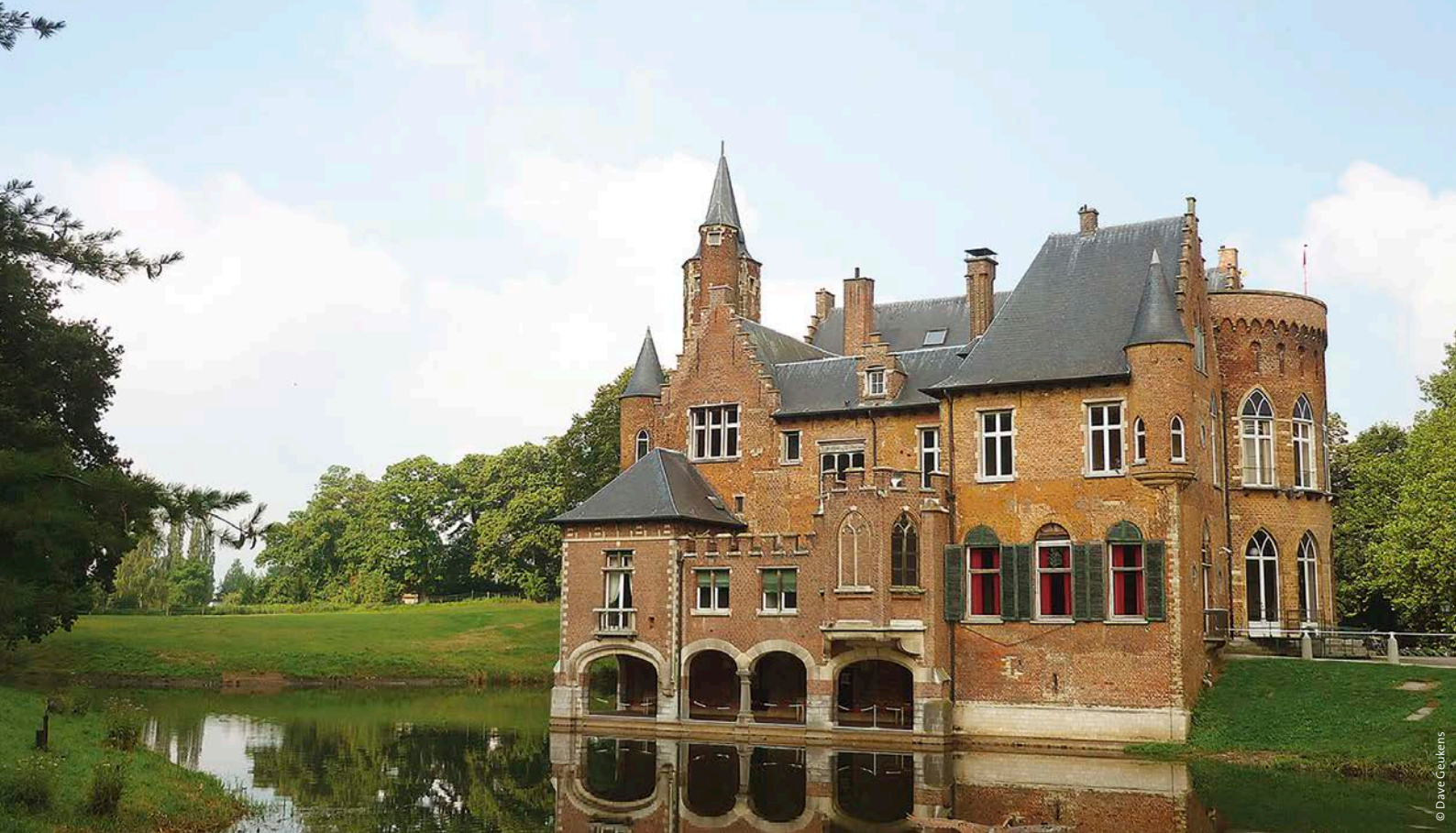
Kasteel van Wissekerke (Kruibeke)