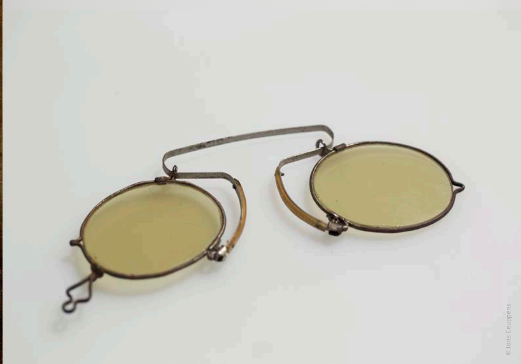
Het knijpbrilletje dat werd gevonden in het kasteel