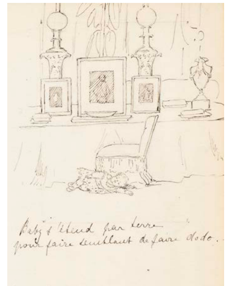
Baby ligt op de grond en doet alsof hij slaapt