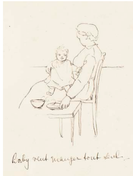
Baby wil zelf eten