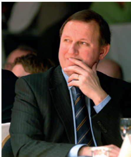
Dirck Van Mechelen

De Monumentenstrijd, een programma op Canvas, waar vijftien monumenten naar de gunst van het publiek dongen, was een groot succes. De minister is zeer tevreden over de eerste editie. 'Monumentenstrijd zorgde ervoor dat heel Vlaanderen praatte over erfgoed. Dankzij de grote aandacht was 'erfgoed' niet weg te branden uit de actualiteit. Vlamingen konden op een prettige, maar toch inhoudelijke manier, kennismaken met de veelzijdigheid van ons erfgoed, maar