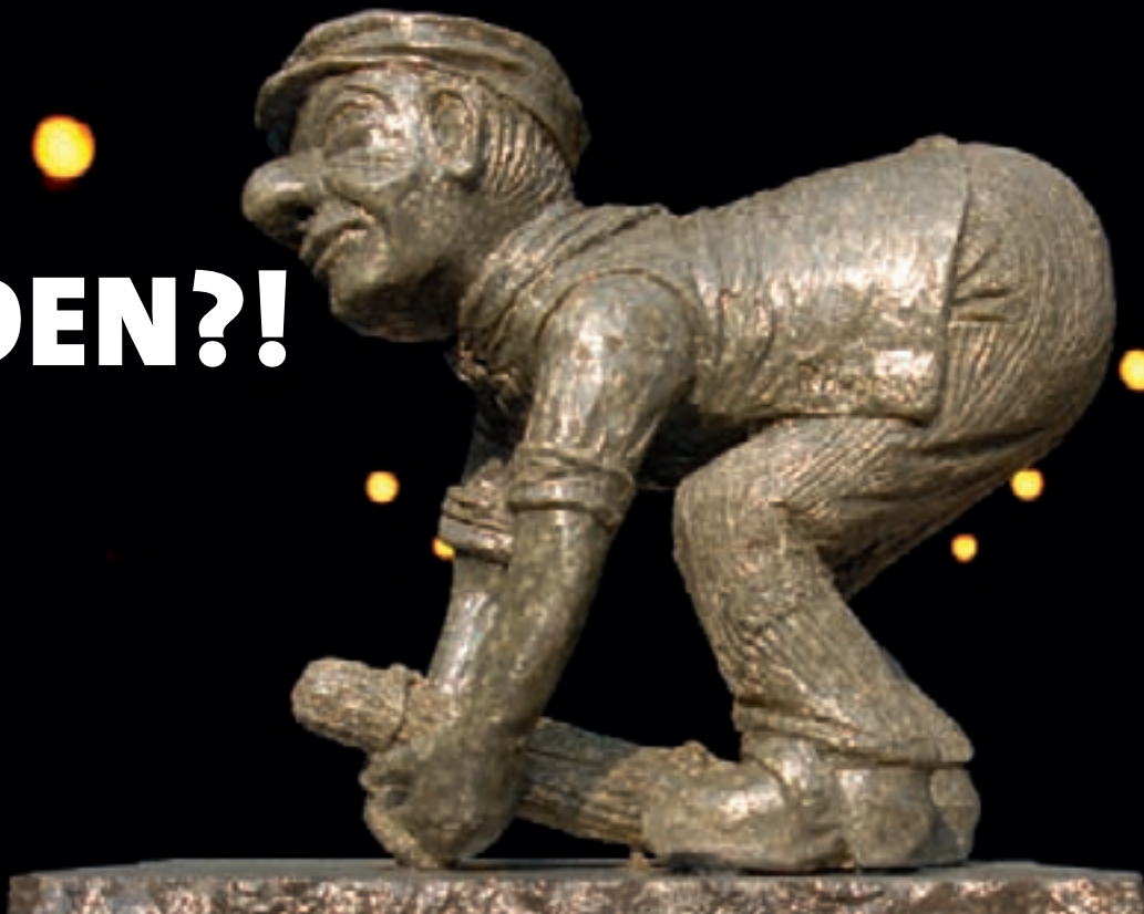
Ne slijkneus , Renild Heymans, 2006 (Streekmuseum De Zilverreiger)