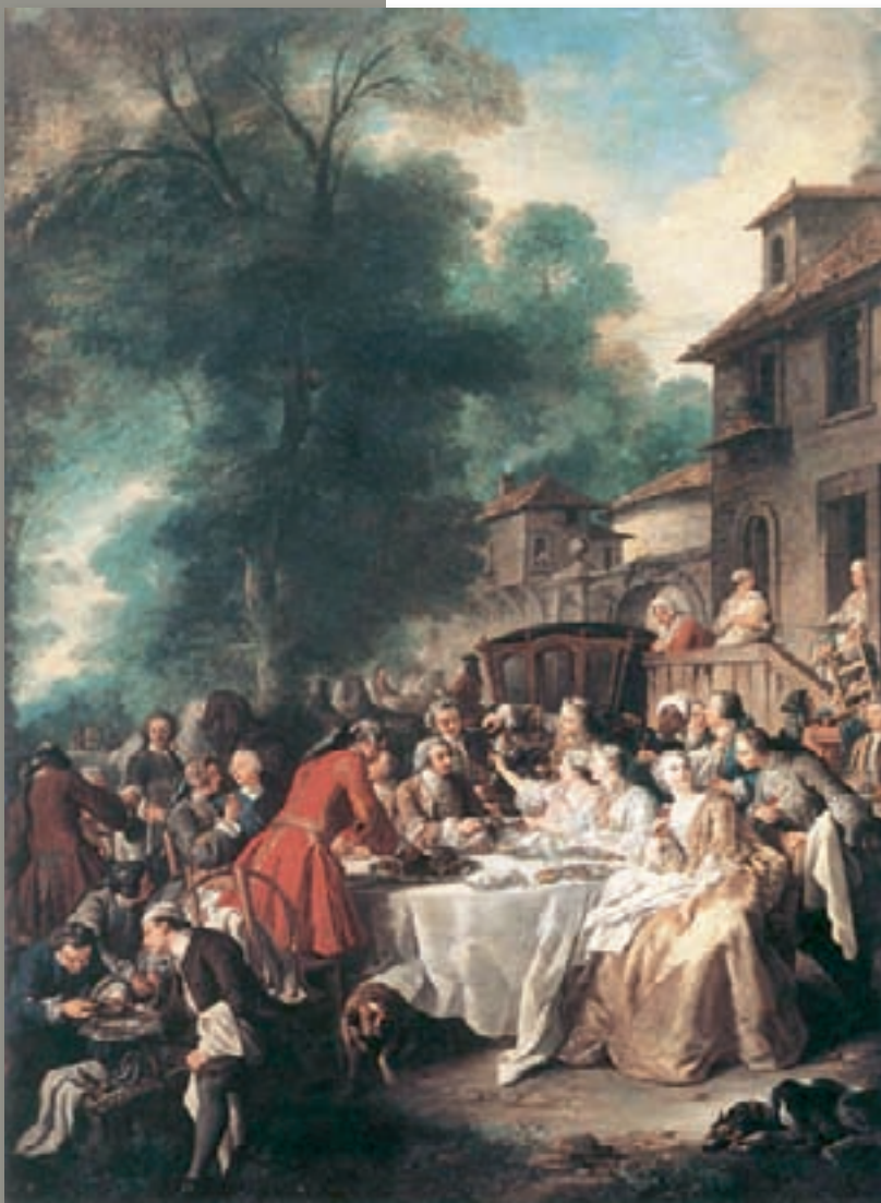
Jean François de Troy: Le Repas de Chasse , 1737, Parijs, Musée du Louvre