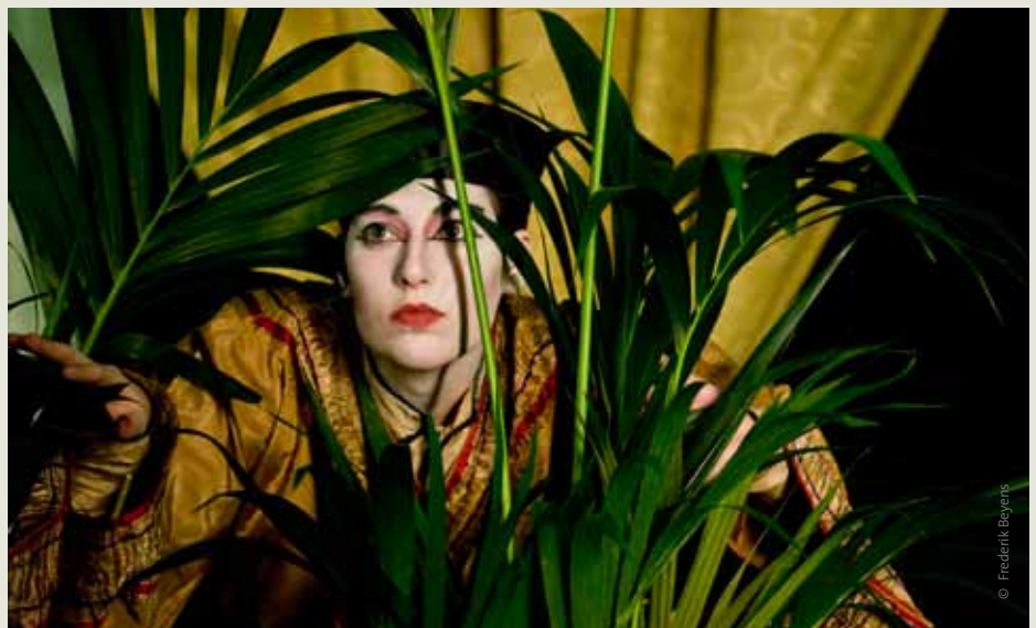
Signoôr in China