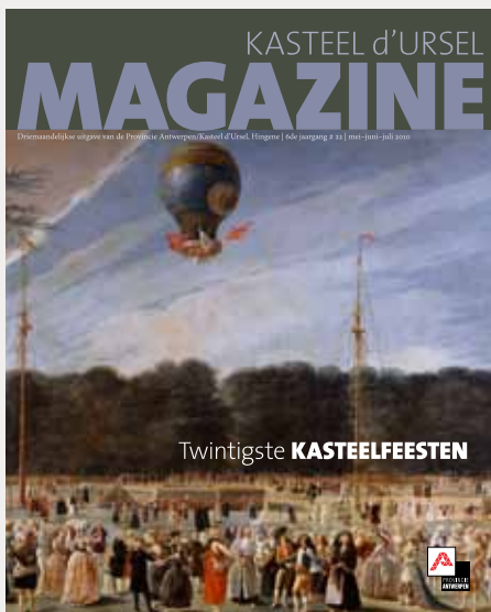
Antonio Carnicero Mancio (1748–1814), Ascensión de un Montgolfier en Aranjuez, 1784 , (detail) - Museo del Prado, Madrid