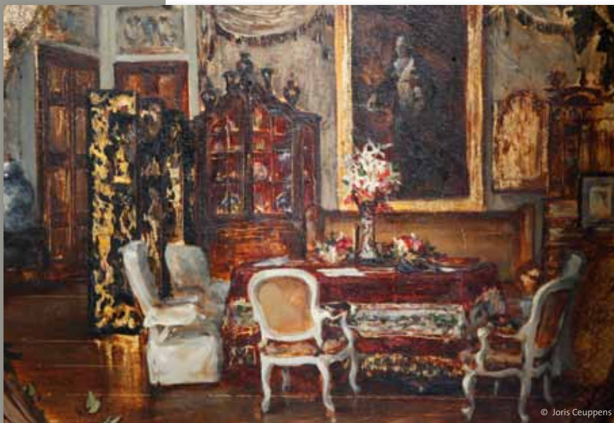
De porseleinkast op haar oorspronkelijke plaats in de grote salon, tussen een Chinees kamerscherm en een schilderij. Het roze Chinese behang werd pas later aangebracht in deze ruimte.

ringen: het appartement dat uitkijkt over de vijver is bijvoorbeeld voorzien van een schitterende 17de-eeuwse wandbespanning. En in de rechtervleugel vinden we ook 'la chambre des petits princes': de kinderkamer, waar de lambriseringen, deuren en open haard net iets kleiner zijn uitgevoerd dan elders. Ook deze restauratiewerken worden uitgevoerd door aannemer pit uit Kapellen, onder leiding van Architectenbureau Vanhecke & Suls uit Wilrijk. Ze zullen vermoedelijk tot eind 2011 duren.