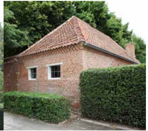
Het poortgebouw in zijn oorspronkelijke toestand, als ruïne en na restauratie