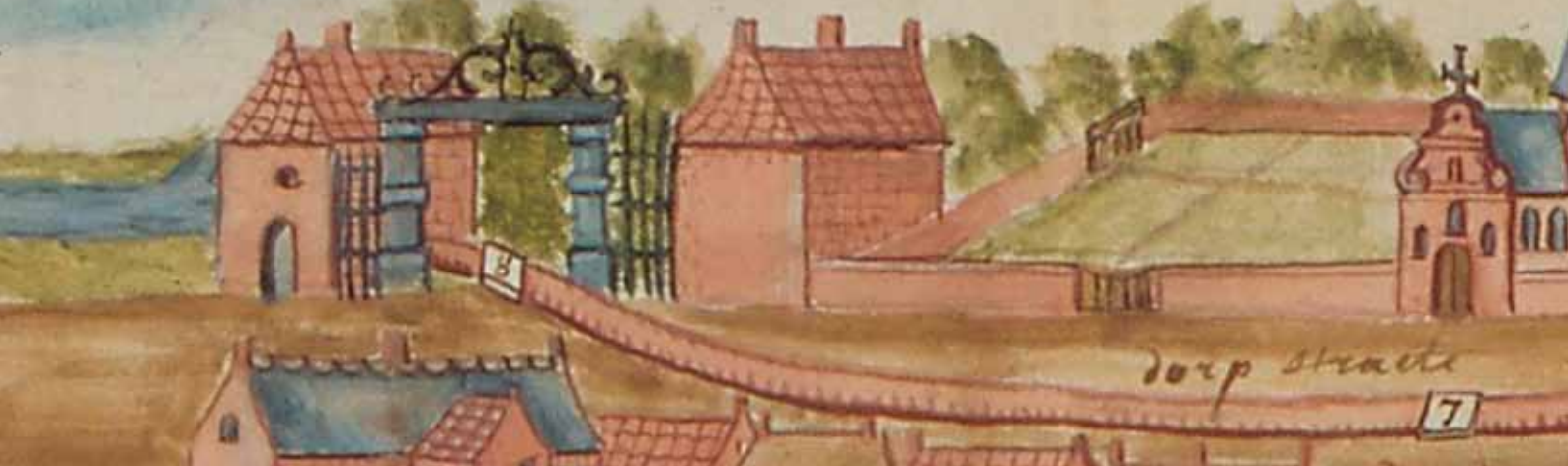
Detail uit een technische kaart van een waterleiding naar de brouwerij op het domein van de hertog, 1755.

Geaquarreleerde pentekening, Algemeen Rijksarchief Brussel, Familiearchief d'Ursel. Actes relatifs aux biens . Hingene, r 105.