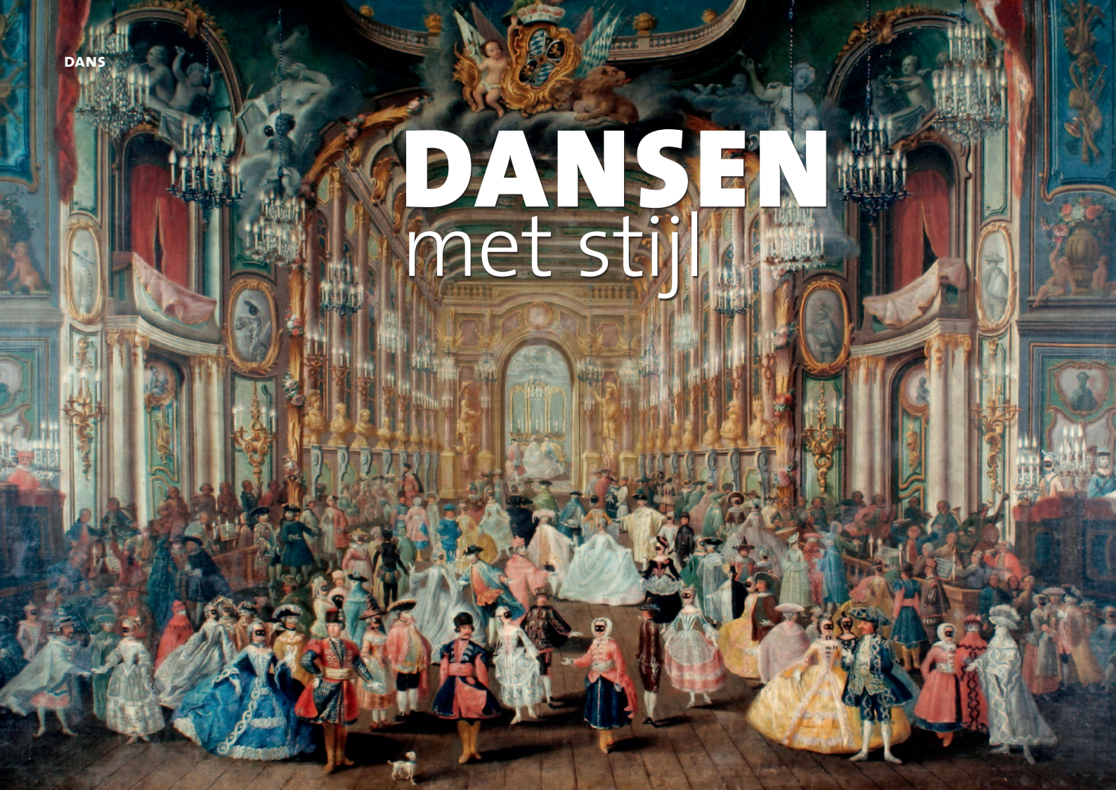
Francois Rousseau, Maskenball im Bonner Hoftheater 'Bönnsches Ballstück', 1754 · Dauerleihgabe des Kölnischen Stadtmuseums

Dit seizoen staan er opnieuw enkele opmerkelijke historische dansactiviteiten op het programma. Voor het dansgedeelte werken we sinds vorig jaar samen met de Stichting Klassieke Dans, die naast klassieke dans en een studio voor kostuumontwerp, ook een barokafdeling in huis heeft.