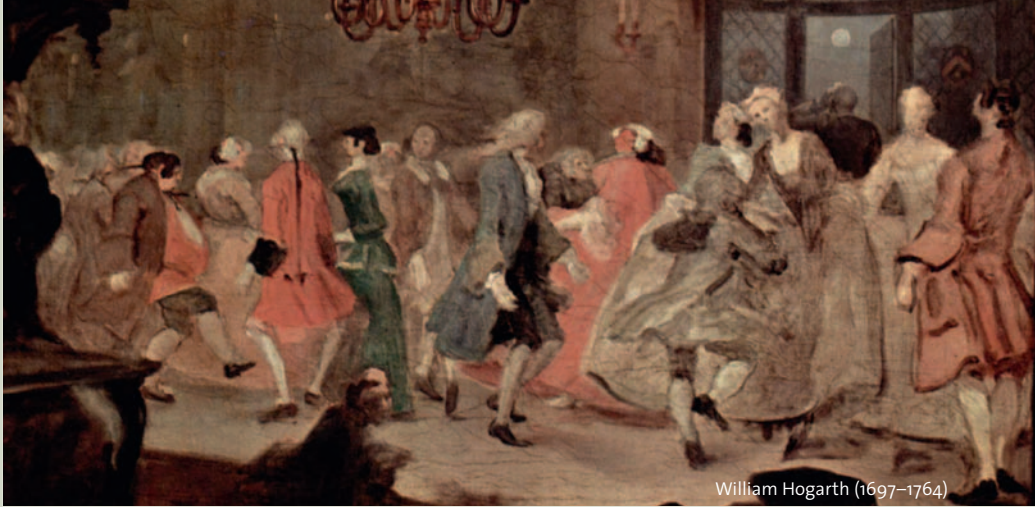
William Hogarth (1697-1764)