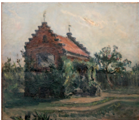
Het schildersatelier, zoals het door Antonine werd afgebeeld op een kamerscherm

In een uithoek van het park staat een mysterieus, vervallen gebouwtje. Ooit was dat het schildersatelier van een artistieke hertogin.