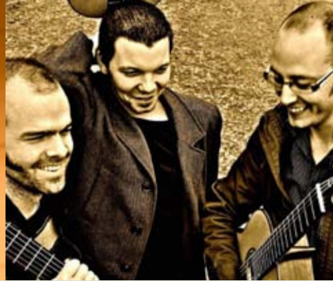
Los Del Tre