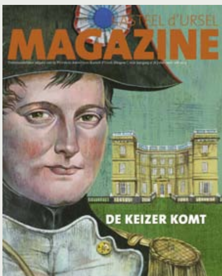
Illustratie: © Olaf Hajek