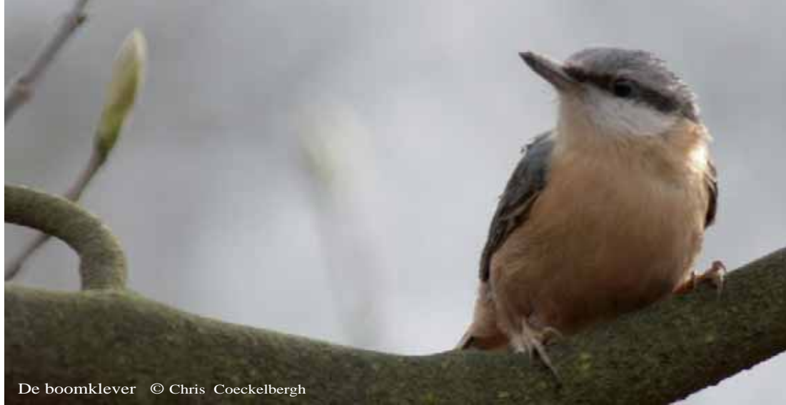
De boomklever © Chris Coeckelbergh