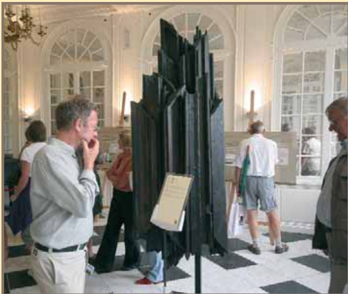
Fragmenten van twee tentoonstellingen: een werk van kunstenaar Vic Gentils en twee panelen van 'Hout in het kasteel'