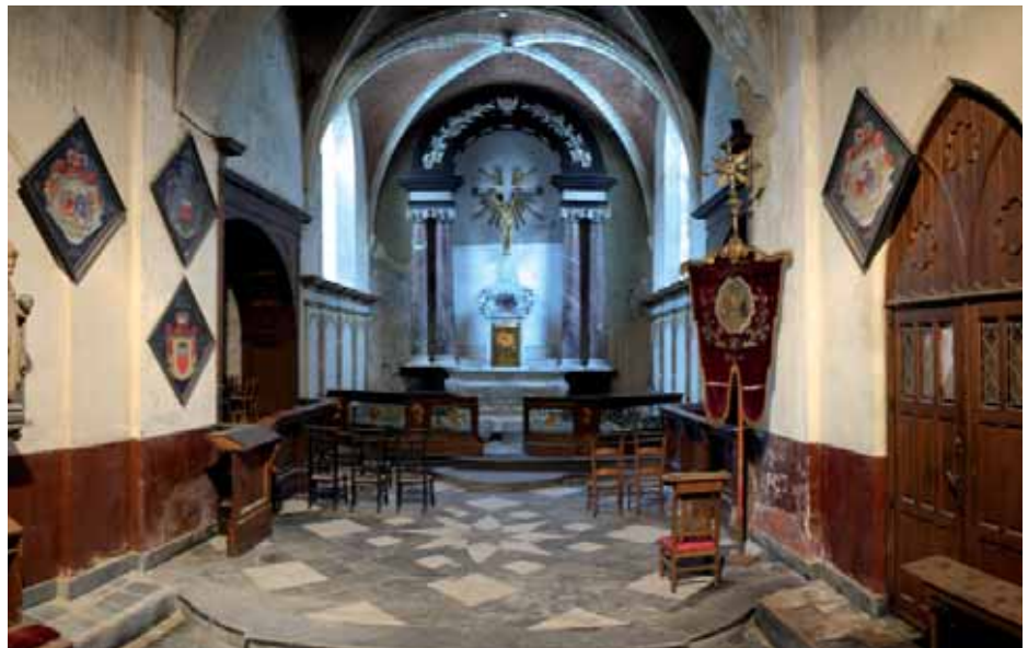
Het hoogkoor van de oude kerk, zoals het er vandaag uitziet.

In het eerste hoofdstuk verwelkomt lokaal historicus Benny Croket je in het Hingene van voor 1900. Het einde van de 19de eeuw was een tijd van grote maatschappelijke veranderingen, die ook in een klein dorpje niet onopgemerkt voorbij gingen. De